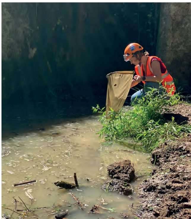
Opération de déplacement d'espèces

Les travaux réalisés en cours d'eau impliquent la prise en compte de la biodiversité, tout au long de la vie du chantier, avec la mise en œuvre d'actions permettant de limiter les impacts sur les milieux et les espèces.