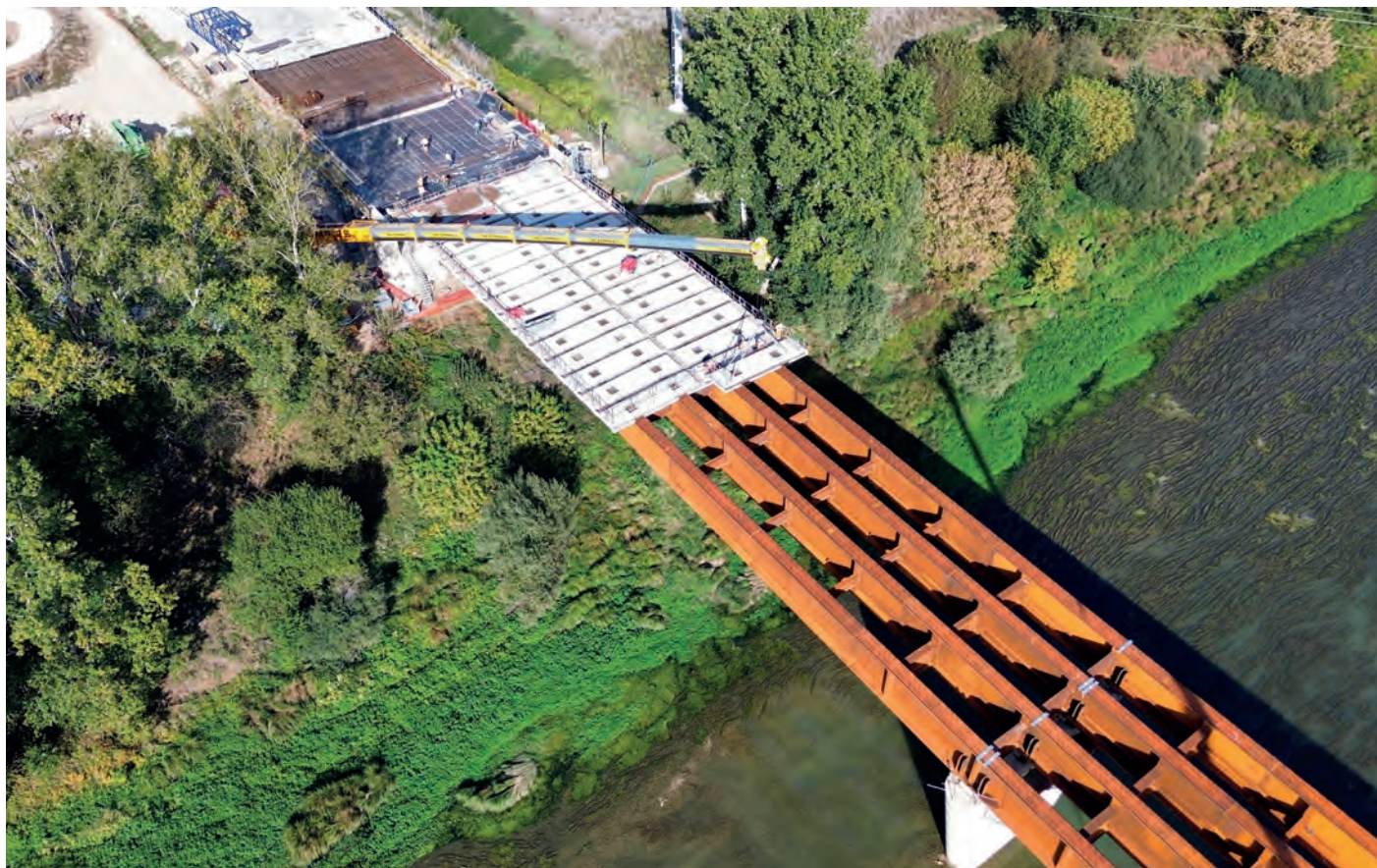
Phase d'envergure avec la pose des dalles de béton préfabriquées