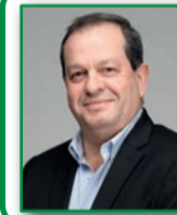
Thierry VALETTE Maire de Saint-Martin-de-Beauville Membre du bureau délégué Énergies renouvelables