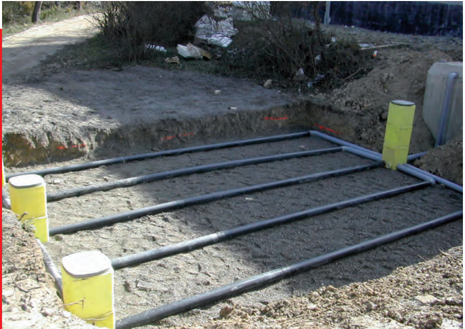
Filtere à sable vertical