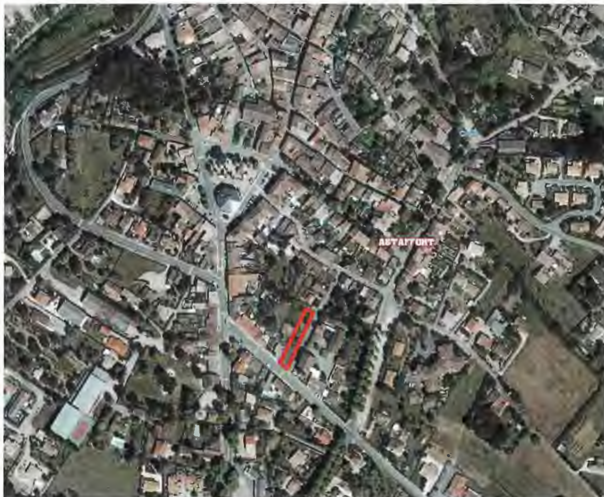
L'emplacement réservé n°3, En face de l'école